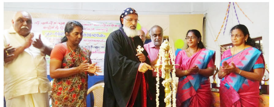
പാമ്പാടി എം.ഡി. എൽ.പി. സ്കൂൾ 140-ാമത് വാർഷികം