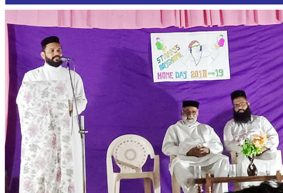
തലക്കോട് സെന്റ് മേരീസ് ബോയ്സ് ഹോമിന്റെ വാർഷിക സമ്മേളനം.